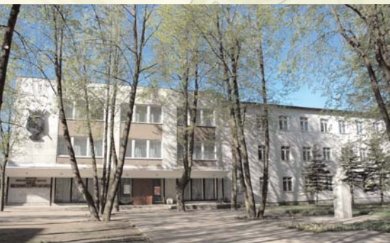
ДМШ им. М.П. Мусоргского