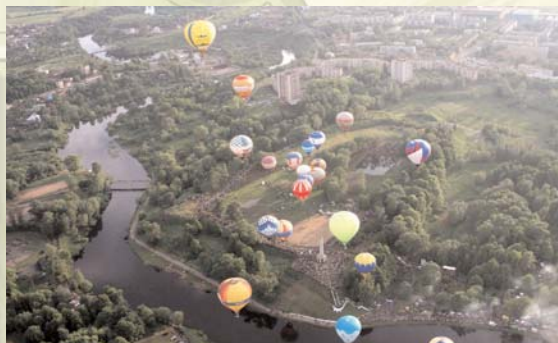
Ежегодный Международный чемпионат по воздухоплаванию